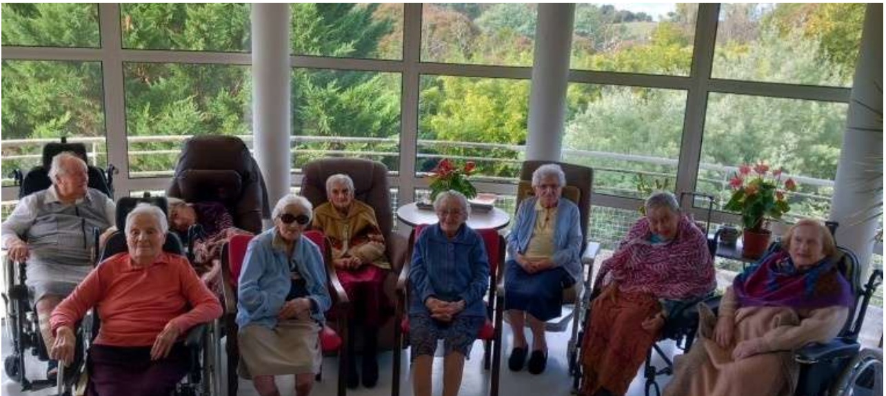
Nb : La 10ème centenaire était en soins lors de la prise de la photo.

Le secret de cette longévité ? Les résidentes invoquent principalement le travail , souvent depuis leur plus jeune âge, mais aussi le climat, l'environnement et le bon foie gras du Gers !